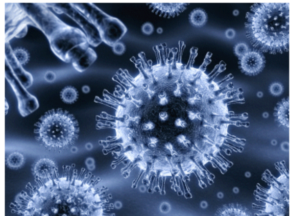
Internet, immagine di un organismo vivente?

immediato, in competizione su un tema e fra i diversi temi.